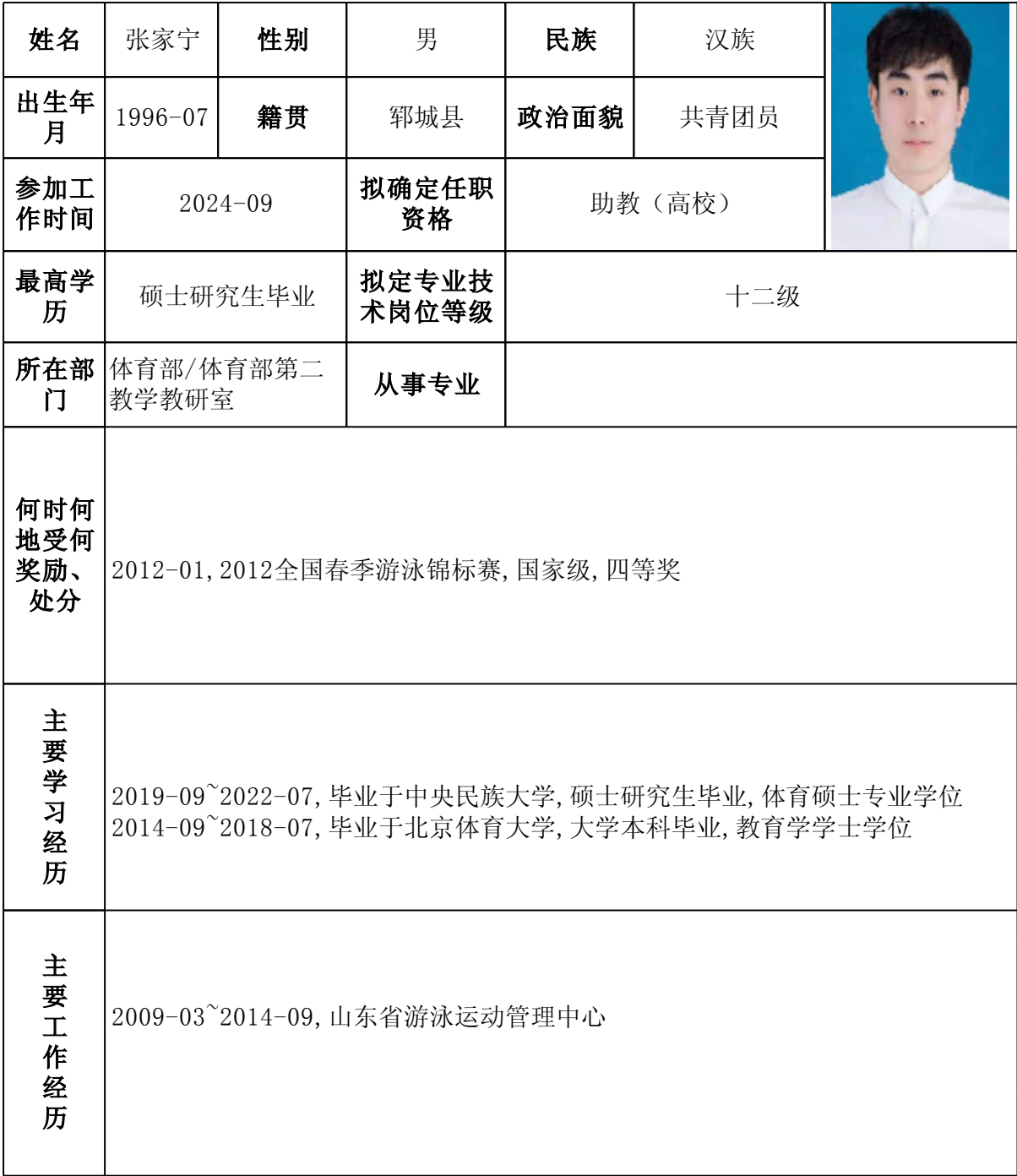
专业技术职务任职资格审批表